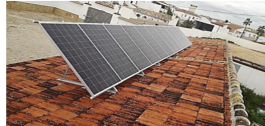
Imagen 2. Instalación fotovoltaica no integrada en cubierta

Respecto al seguimiento solar , las instalaciones fotovoltaicas pueden ser fijas o con seguimiento solar. En este último caso, el panel o módulo fotovoltaico girará sobre uno o dos ejes buscando la optimización del rendimiento, que es máximo cuando la luz del sol incide perpendicularmente sobre el panel. Un sistema de seguimiento permite aumentar la generación fotovoltaica , pero implica una mayor inversión y costes de mantenimiento añadidos , por lo que habrá que sopesar la idoneidad en cada caso.