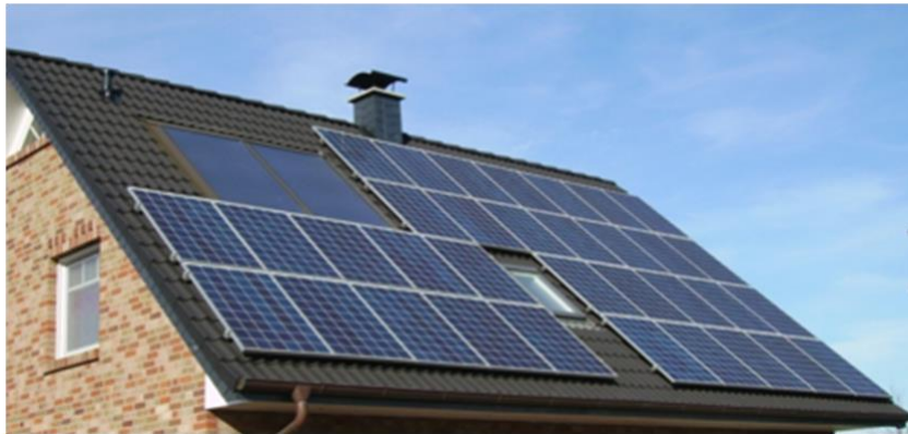
Imagen 1. Instalación fotovoltaica integrada en cubierta

Dos conceptos importantes sobre los que conviene profundizar, son la posibilidad de seguimiento solar que ofrece la tecnología fotovoltaica y la integración arquitectónica de la instalación .